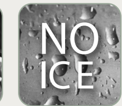
Wewnętrzna ściana misy z systemem przeciwoblodzeniowym Pareti interne vasca con sistema anti ghiaccio