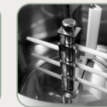
Zdejmowane narzędzie do mieszania MAMA15/30/80/120 Utensile estraibile per MAMA15/30/80/120