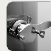
Wylewka Inox 2" 1/2 zdejmowany do czyszczenia Rubinetto inox a taglio da 2"1/2 estraibile per pulizia