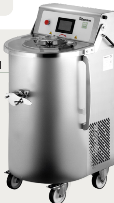
MAMA 80 / 120 TOUCH