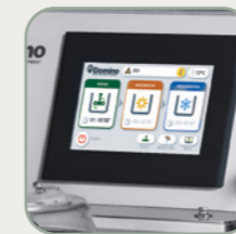
Ekran dotykowy MAMA 15 TOUCH/30TOUCH/80 TOUCH/120 TOUCH/300 TOUCH