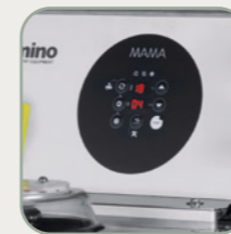
Cyfrowy wyświetlacz MAMA 15/30/80/120 Display digitale per MAMA 15/30/80/120

MAMA 15 / 30 / 80 / 120 MAMA 15 TOUCH / 30 TOUCH / 80 TOUCH / 120 TOUCH / 300 TOUCH